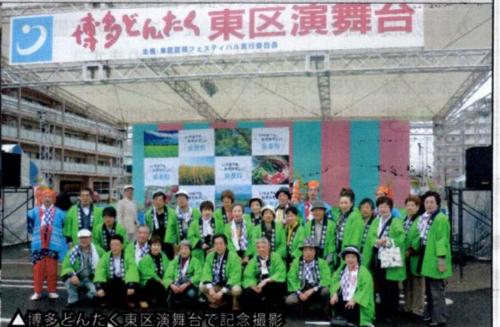
▲博多どんたく東区演舞台で記念撮影