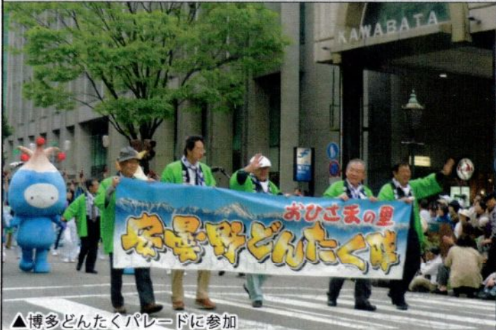
▲博多どんたくパレードに参加

発行:安曇誕生の系譜を探る会 発行責任者:金井 恂 編集委員長:本郷 敏行 事務局長:浅川隆 〒399-8304 長野県安曇野市穂高柏原3612-3